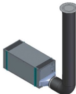
Εικόνα 2. Σκαρίφημα της μονάδας με την σωλήνα απόρριψης